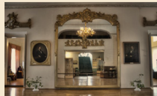
ЗАЛ С ЗЕРКАЛАМИ, УСАДЬБА БУТИНЫХ