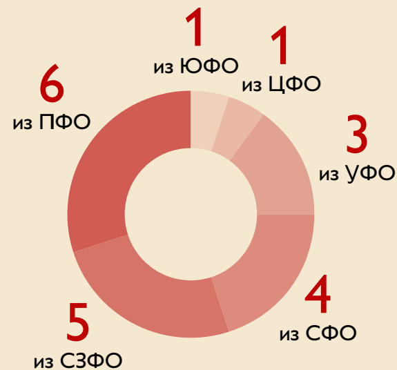
Распределение победителей по федеральным округам

Конкурс «Культурная мозаика: Партнёрская сеть» — это новый этап в развитии «Культурной мозаики малых городов и сёл». Реализация проектов будет длиться два года. Финансирование разделено на два этапа, при этом решение о переходе на следующий