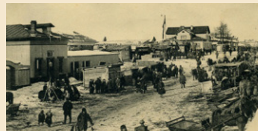
ПИНЕЖСКАЯ ЯРМАРКА. НАЧАЛО XX ВЕКА

ству народного просвещения. Улица каменных домов, принадлежавших семейству, сохранилась. До сих пор в народе ее называют «Володинский квартал».