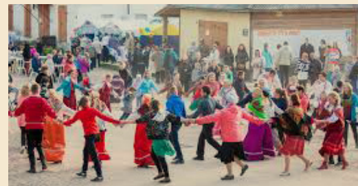
ГОРОДОВОЙ ПРАЗДНИК «ДЕНЬ ПИНЕГИ»